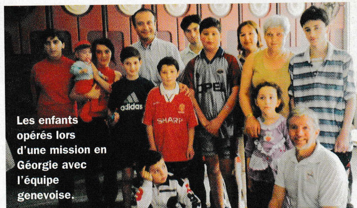
Les enfants opérés lors d'une mission en Géorgie avec l'équipe genevoise.